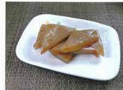
◆ 生芋こんにゃくの煮物 ●100g～ 277円(税込300円)～ 群馬県産の蒟蒻芋を使用した、蒟蒻の風味と食感のある惣菜。