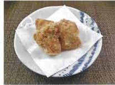
◆鶏肉唐揚げ ●100g～ 237円(税込256円)～ 国産の鶏胸肉を使用した唐揚げ。