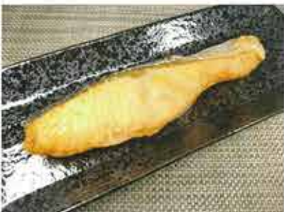
◆銀鮭の塩焼き ●1切れ 360円(税込389円) 程良い塩加減で、ふっくら焼き上げました。