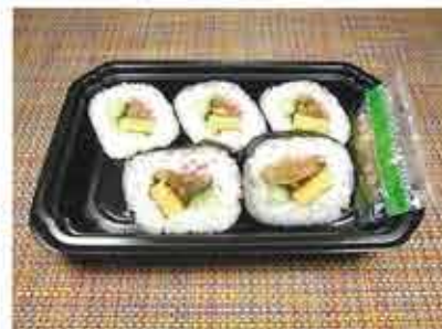
◆巻寿司 ●1パック(5切入) 255円(税込276円) 一口サイズの食べやすい巻寿司。