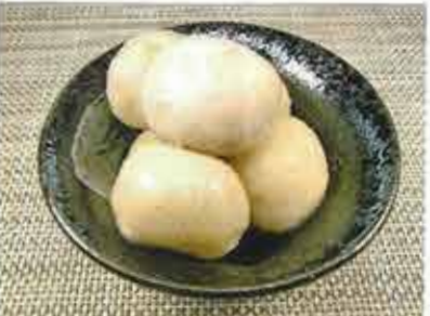
◆ 里芋の含め煮 ●100g～ 306円(税込331円)～ 九州産の里芋をじっくり煮込んだ煮物。