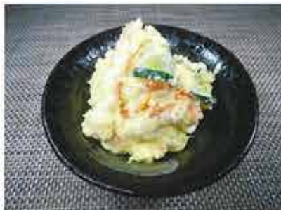
◆ポテトサラダ ●100g～ 213円(税込231円)～ 中身は、じゃが芋・胡瓜・人参・卵。味付けもマヨネーズ・塩コショウとシンプル。