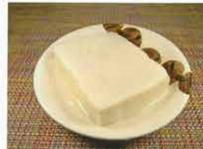
◆ 高野豆腐の含め煮 ●1枚 112円(税込121円) 鰹ダシをたっぷり含ませた惣菜。