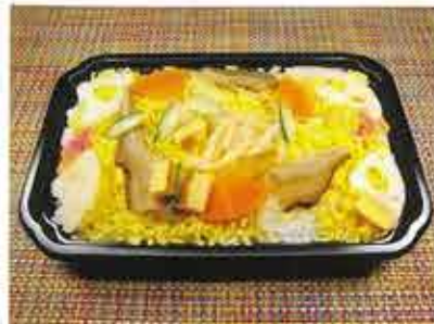
◆田舎ちらし寿司 ●1パック(約220g) 344円(税込372円)～ シンプルな具沢山のちらし寿司。