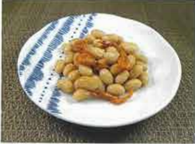
◆ えび豆煮 休止中 ●100g～ 200円 北海道産大豆と琵琶湖産川海老を、柔らかく炊いた郷土料理。