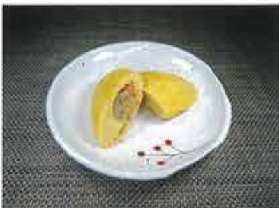
◆ミニオムレツ ●1個 140円(税込152円) 鶏ミンチと玉ねぎ・人参の餡を一個一個丁寧に焼き上げました。