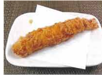
◆海老フライ ●1尾 236円(税込255円) 大ぶりの海老をフライにしました。