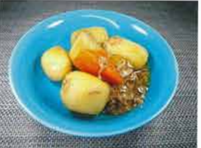
◆ 肉じゃが ●100g～ 250円(税込270円)～ 醤油、みりん、砂糖で、ことことじっくり牛肉と煮込みました。