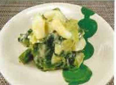
◆ ねた ●100g～ 340円(税込368円)～ ねぎとイカの酢味噌和えて、昔ながらの味。