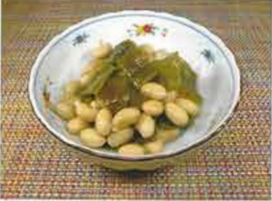
◆ 昆布豆 ●100g～ 195円(税込211円)～ 北海道産の昆布・大豆を使用し、圧力釜で柔らかく炊き上げました。