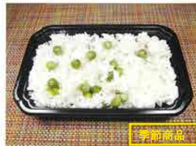
◆豆ごはん 終了 ●1パック(160g) 370円 和歌山県産うすいえんどう豆を、塩味だけで炊き上げた、春の香りのご飯。