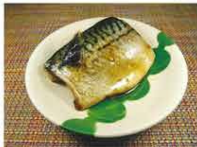
◆さばの煮つけ ※腹部 尾部があります ●1切 250円(税込270円) ダシが餡状になるまで鯖と煮詰めた 惣菜。