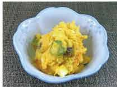
◆南瓜とポテトのサラダ ●100g～ 241円(税込261円)～ 南瓜・ポテト・きゅうり・人参・卵を、マヨネーズ・塩コショウで味付け。