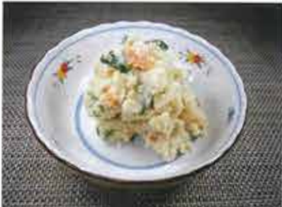
◆ うの花 ●100g～ 148円(税込160円)～ 良質の「おから」を使用ししっかりとした食感の惣菜。