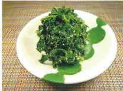
◆ほうれん草のおひたし ●100g～ 342円(税込370円)～ 炒り胡麻の香りが食欲をそそる おひたしの定番。