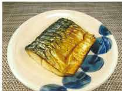
◆鯖の塩焼き ●1切れ 237円(税込256円) 程良い塩加減で、ふっくら焼き上げました。