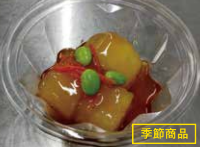
◆ とうがん煮 休止中 ●100g～ 324円 とうがんを甘めのだしでじっくり炊き上げた春～夏の季節煮物。