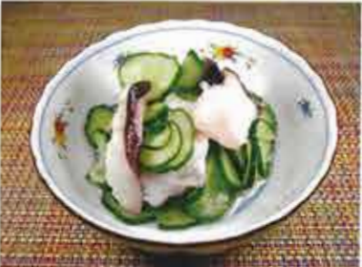
◆ たこときゅうりの酢の物 ●80g～ 296円(税込320円)～ 酢の酸味と胡瓜でサッパリいただける、定番商品。(80g単位でご注文)