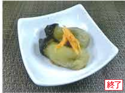
◆小なすのおひたし ※写真は2個です。 ●1食(5個入) 449円 皮を取り、滑らかな食感の後味の良いおひたし惣菜。