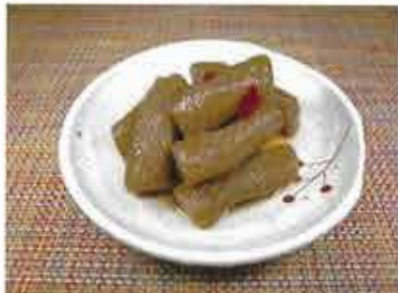
◆ ねじりこんにゃくの煮物 ●100g～ 204円(税込221円)～ 唐辛子が入ったダシで炊いた、少しピリッと辛い煮物。