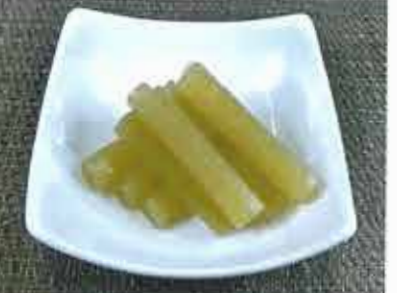
◆ 国産ふきの煮物 休止中 ●100g～ 300円(税込324円)～ 高知・徳島県産のふきを丁寧に炊いた昔ながらの煮物。