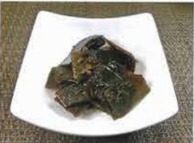
◆ 山椒昆布の佃煮 ●80g～ 333円(税込360円)～ 北海道産昆布と国産山椒を使用。ピリリと山椒が効いた佃煮。