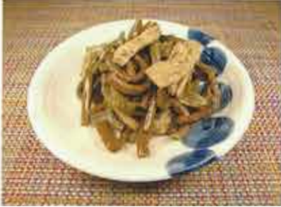
◆ ぜんまいと揚げの煮物 ●100g～ 260円(税込281円)～ 三度に渡り柔らかく炊き上げた「ぜんまい」と、そのダシを吸った「油揚げ」の煮物。