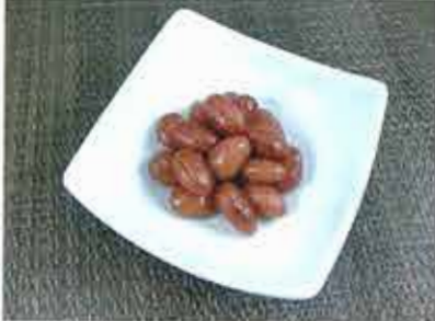
◆ 金時豆 ●100g～ 192円(税込208円)～ 北海道産大正金時を圧力釜で柔らかく炊き上げた煮豆。