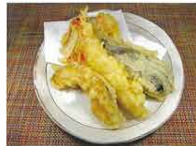
◆天ぷら盛合せ ●1セット 446円(税込482円) 海老の天ぷら・季節のかき揚げ・季節野菜の天ぷら等の盛合せ。※季節により内容が変わります。