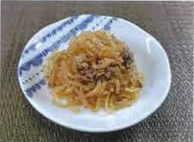
◆ しらたきと牛肉のしぐれ煮 ●100g～ 241円(税込261円)～ しらたきと牛肉をじっくり炊き込みました。