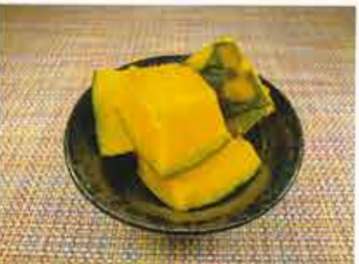
◆ なんきんの煮物 ●100g～ 260円(税込281円)～ かぼちゃの風味とダシの旨味をたっぷり含んだ煮物。