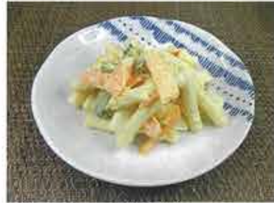
◆マカロニサラダ ●100g～ 218円(税込236円)～ 中身は、マカロニ・胡瓜・人参・卵。味付けもマヨネーズ・マスタード・塩 コショウとシンプル。