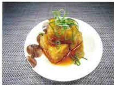
◆揚げ出し豆腐 ●1パック 3個入 267円(税込289円) 油で揚げた豆腐に、甘目のダシが染み込んだ揚げ物。