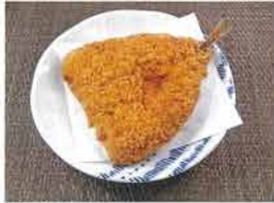
◆あじフライ ●1尾 147円(税込159円) 大きめの肉厚な「あじ」をサクッと衣が香ばしいフライにしました。