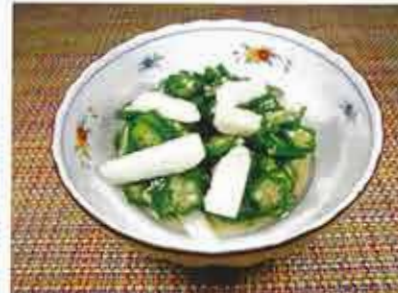
◆ オクラと長芋のおひたし ●100g～ 255円(税込276円)～ 細かく刻んだオクラに長芋を加えて、鰹風味のダシに浸しました。