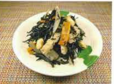
◆ 五目ひじき ●100g～ 260円(税込281円)～ 大豆・人参・ごぼう・ひじきと食物繊維が豊富な惣菜。