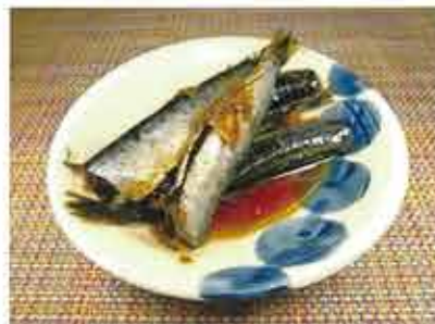
◆いわしの煮つけ ●100g 287円(税込310円) 一口サイズの小さいいわしを生姜入れて 煮詰めた惣菜。