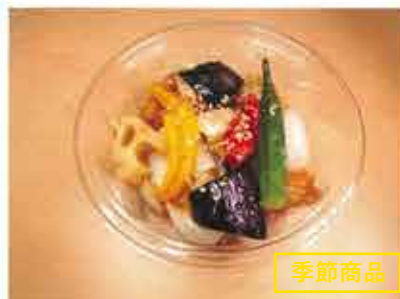
◆鶏唐揚甘酢和え 休止中 ●1パック 334円 鶏唐揚と玉ねぎ・茄子 蓮根・おくら パプリカに甘酢を絡めた、彩り良い 揚げ物惣菜。