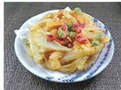
◆野菜かきあげ ●1個 147円(税込159円)～ 季節の野菜を彩よく加えた、野菜たっぷりの揚げ物。