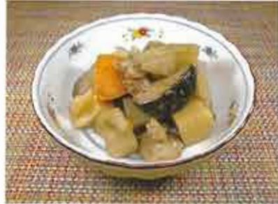
◆ 筑前煮 ●100g～ 306円(税込331円)～ 鶏肉・蓮根・筍・椎茸・蒟蒻など、素材から出た天然ダシの旨味を生かした煮物。