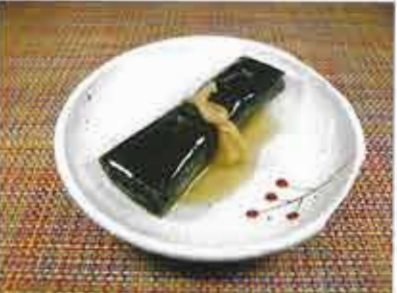
◆ 日高昆布のにしん昆布巻き ●1本 246円(税込266円) 国産鰯を北海道の道産南昆布で巻いて醤油ダシで炊き上げた昆布。