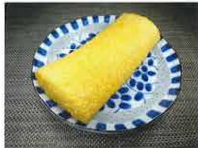
◆出し巻卵 ●1本 354円(税込383円)～ 鰹ダシがたっぷり入った卵焼き。