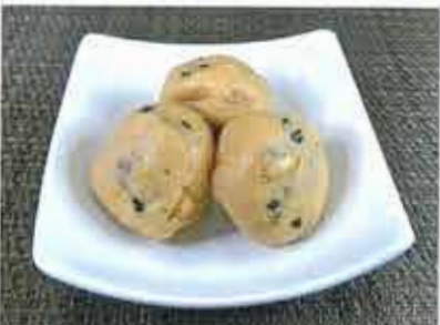
◆ つぶらがんも *写真はイメージです ●1食(5個人) 240円(税込260円) 黒豆入りのがんもを、鰹ダシをたっぷりふくませた惣菜。