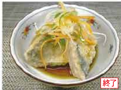
◆アジ切身の南蛮漬 終了 ●1切れ 150円 ※写真は2切れです。 小振りなアジのから揚げを、酸味の効いたタレに漬け込みました。