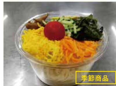
◆そうめん 終了 ●1食 452円 鰹と昆布から抽出した、薄味の特製ダシでお召上がりください。