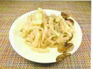
◆ 切干大根とおあげの煮物 ●100g～ 232円(税込251円)～ 宮崎県産の天日干した切干大根とお揚げの煮物。