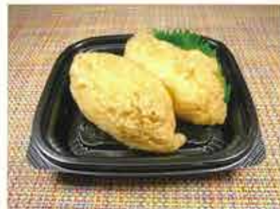
◆いなり寿司 ●1パック(2ケ入) 196円(税込212円)～ 自家製ダシで煮詰めたお揚げに、程よい甘さの酢飯のいなり寿司。