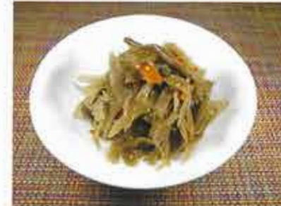
◆ 金平ごぼう ●100g～ 260円(税込281円)～ 唐辛子と甘目のダシで、少しピリ辛に炊いた惣菜。