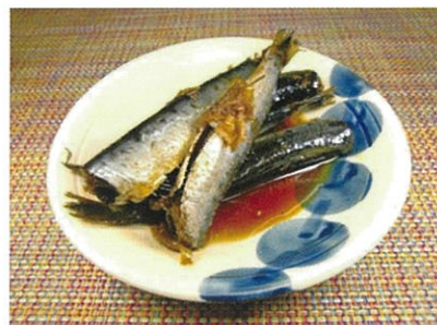
◆いわしの煮つけ ●100g～ ¥260～ 一口サイズの小さいいわしを生姜入れて煮詰めた惣菜。