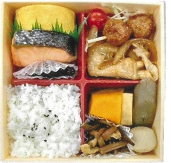
内寸 15.8×15.8×3 cm

菜々弁当 (季節ご飯) ・主菜・・・焼鮭。 ・副菜・・・だし巻卵、煮物、和え物等。 ・ご飯・・・白ご飯+季節ご飯。 ※白ご飯を赤飯に変更できます。(+50円) 【販売価格】 ・直営店 540円 (税込) ・西武大津、近鉄草津、コトチカ山科 520円 (税別) ・その他の店舗 540円 (税別)