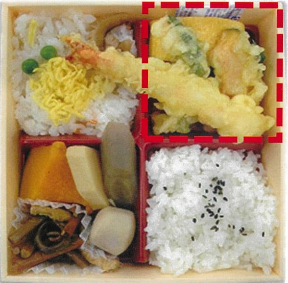
内寸 15.8×15.8×3 cm

一番人気・お値段お得 菜々弁当 (ちらし寿司) ・主菜・・・①天ぷら、②煮さば、③焼鮭、④焼さば、⑤ハンバーグ。 ・副菜・・・だし巻卵、煮物、和え物等。 ・ご飯・・・白ご飯+ちらし寿司。 ※白ご飯を赤飯に変更できます。(+50円) 【販売価格】 ・直営店 540円 (税込) ・西武大津、近鉄草津、コトチカ山科 520円 (税別) ・その他の店舗 540円 (税別)