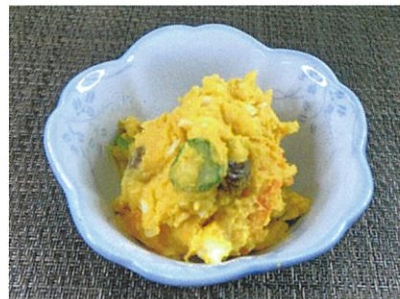
◆南瓜とポテトのサラダ ●100g～ ¥350～ 南瓜・ポテト・胡瓜・人参・卵・レーズンを、マヨネーズ・塩コショウで味付け。