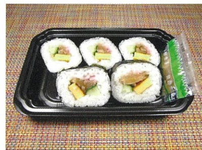
◆巻寿司(5切入) ●1パック(5切入) ¥250 一口サイズの食べやすい巻寿司。