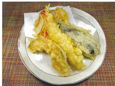
◆天ぷら盛合せ ●1セット ¥460 海老の天ぷら・季節のかき揚げ・季節野菜の天ぷら等の盛合せ。 ※季節により内容が変わります。