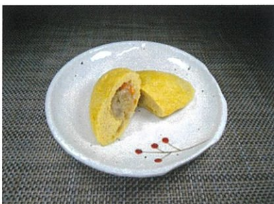
◆ミニオムレツ ●1個 ¥120 合挽きミンチと玉ねぎ・人参の餡を一個一個丁寧に焼き上げました。