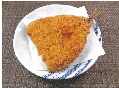
◆あじフライ ●1尾 ¥140 大きめの肉厚な「あじ」をサクッと衣が香ばしいフライにしました。