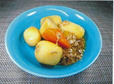
◆肉じゃが ●100g～ ¥240～ 醤油、みりん、砂糖で、ことことじっくり牛肉と煮込みました。