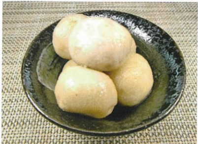
◆里芋の含め煮 ●100g～ ¥350～ 九州産の里芋をじっくり煮込んだ煮物。