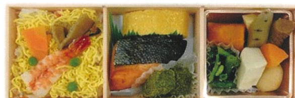
内寸 28.5×9.5×4.3 cm