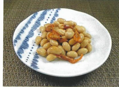
◆えび豆煮 ●100g～ ¥200～ 北海道産大豆と琵琶湖産川海老を、柔らかく炊いた滋賀の郷土料理。