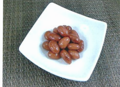
◆金時豆 ●100g～ ¥200～ 北海道産大正金時を圧力釜で柔らかく炊き上げた煮豆。