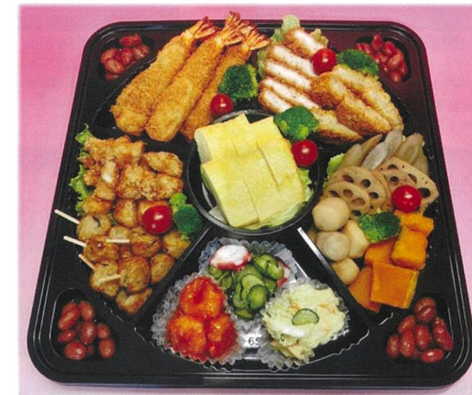
内寸 36×36×4 cm