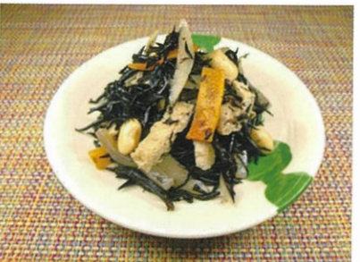
◆五目ひじき ●100g～ ¥270～ 大豆・人参・ごぼう・ひじきと食物繊維が豊富な惣菜。