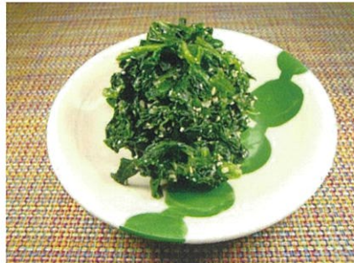
◆ほうれん草のおひたし ●100g～ ¥290～ 炒り胡麻の香りが食欲をそそる、おひたしの定番。