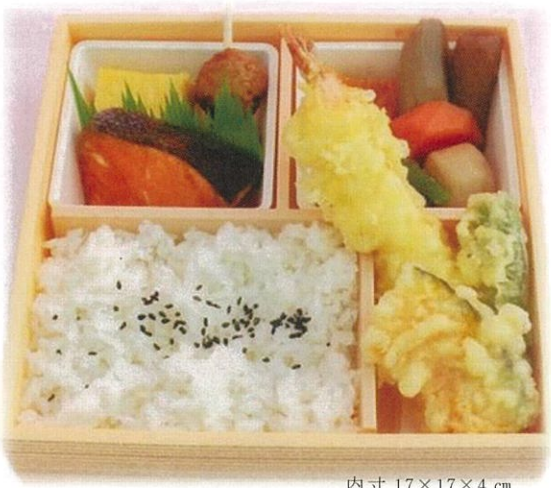
内寸 17×17×4 cm

※ごはんを、ちらし寿司・季節ご飯・赤飯に替える事が出来ます（価格はお問い合わせください）。