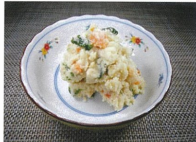
◆うの花 ●100g～ ¥150～ 良質の「おから」を使用ししっとりとした食感の惣菜。