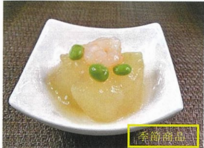
◆とうがん煮 ●100g～ ¥260～ とうがんで甘めのだしでじっくり炊き上げた春～夏の季節煮物。