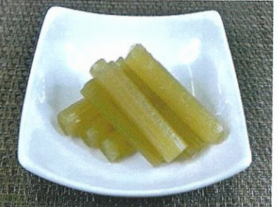
◆国産ふきの煮物 ●100g～ ¥350～ 高知・徳島県産のふきを丁寧に炊いた昔ながらの煮物。