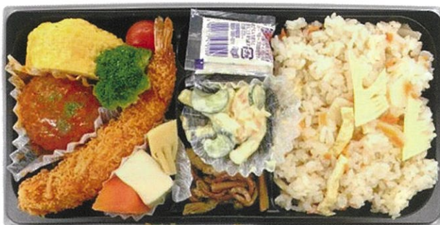
内寸 26.9×13.4×2.2 cm