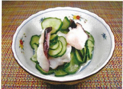
◆たこときゅうりの酢の物 ●80g～ ¥320～ 酢の酸味と胡瓜でサッパリいただける、定番商品。(80g単位でご注文)