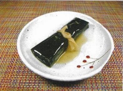
◆日高産昆布のにしん昆布巻き ●1本 ¥180 国産鰯を北海道の日高産昆布で巻いて醤油ダシで炊き上げた昆布巻。