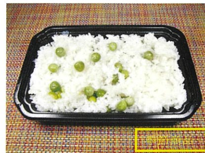
◆豆ごはん ●1パック(約180g) ¥360 和歌山県産うすいえんどう豆を、塩味だけで炊き上げた、春の香りのご飯。