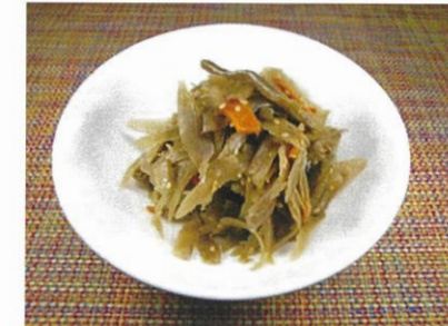
◆金平ごぼう ●100g～ ¥270～ 唐辛子と甘目のダシで、少しピリ辛に炊いた惣菜。