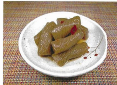
◆ねじりこんにゃくの煮物 ●100g～ ¥210～ 唐辛子の入ったダシで炊いた、少しピリッと辛い煮物。