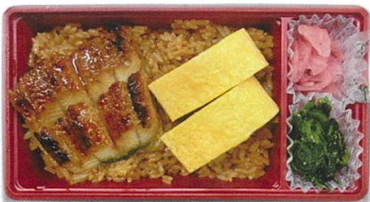
内寸 19.7×10×4 cm