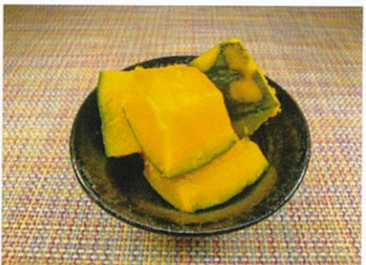
◆なんきんの煮物 ●100g～ ¥270～ かぼちゃの風味とダシの旨味をたっぷり含んだ煮物。