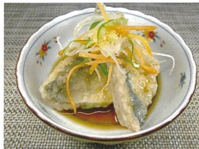
◆アジ切身の南蛮漬 ●1切れ ¥150 ※写真は2切れです。 小振りなアジのから揚げを、酸味の効いたタレに漬け込みました。