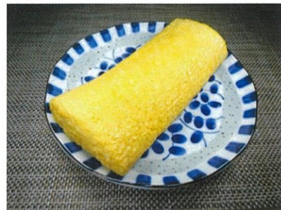
◆出し巻卵 ●1本 ¥350 鰹ダシがたっぷり入った卵焼き。