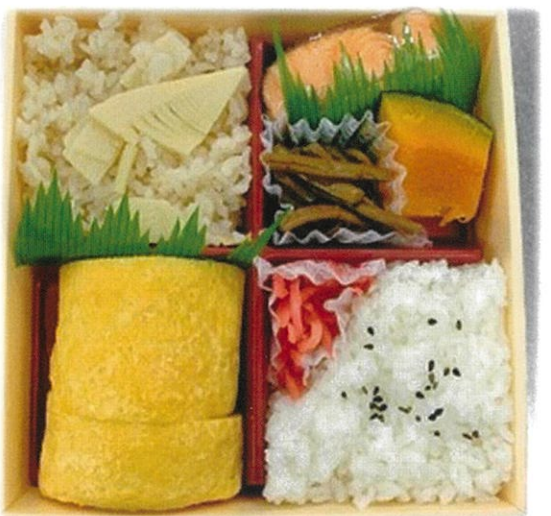
内寸 15.8×15.8×3 cm

菜々弁当 だし巻卵 ・主菜・・・だし巻卵。 ・副菜・・・煮物、和え物等。 ・ご飯・・・白ご飯+季節ご飯。 ※白ご飯を赤飯に変更できます。(+50円) 【販売価格】 ・直営店 560円 (税込) ・その他の店舗 560円 (税別)