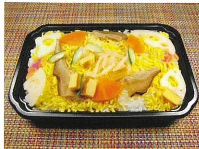
◆田舎ちらし寿司 ●1パック(約220g) ¥350 シンプルな具沢山のちらし寿司。