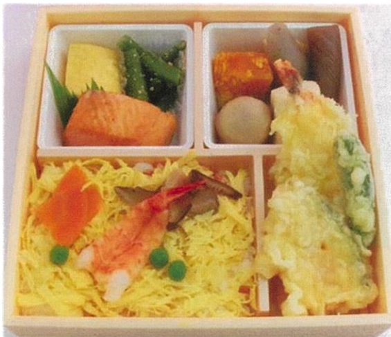
内寸 17×17×4 cm