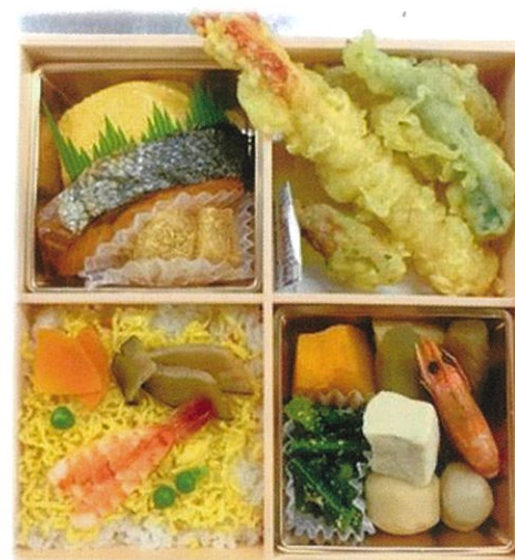
内寸 20×20×4.3 cm