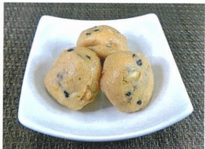
◆黒豆がんもの煮物 ●1個 ¥50 ※写真は3個です。 黒豆入りのがんもを、鰹ダシをたっぷりふくませた惣菜。