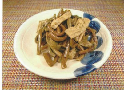
◆ぜんまいと揚げの煮物 ●100g～ ¥270～ 三度に渡り柔らかく炊き上げた「ぜんまい」と、そのダシを吸った「油揚げ」の煮物。