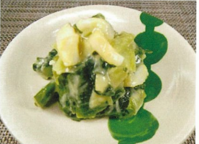
◆ぬた ●100g～ ¥320～ ねぎとイカの酢味噌和えで、昔ながらの味。