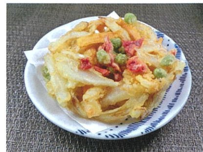
◆野菜かきあげ ●1個 ¥170 季節の野菜を彩よく加えた、野菜たっぷりの揚げ物。