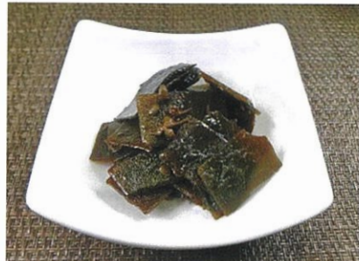
◆山椒昆布の佃煮 ●80g～ ¥351～ 北海道産昆布と国産山椒を使用。ピリリと山椒が効いた佃煮。