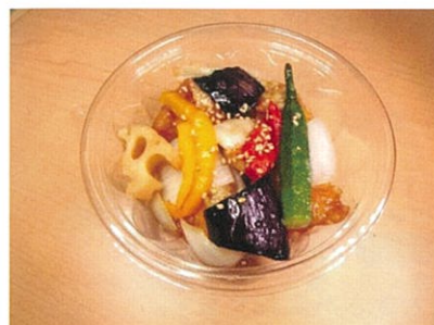
◆鶏唐揚甘酢和え ●1パック ¥.350 鶏唐揚と玉ねぎ・茄子・蓮根・おくら・パプリカに甘酢を絡めた、彩り良い揚げ物惣菜。