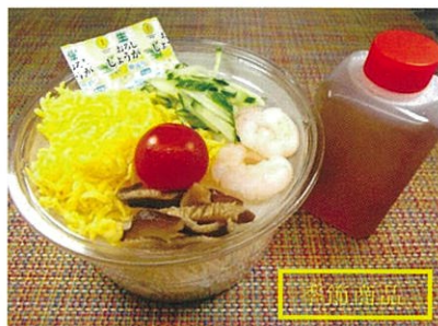
◆そうめん ●1食 ¥430 鰹と昆布から抽出した、薄味の特製ダシでお召し上がり下さい。