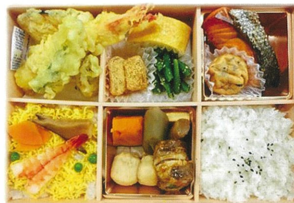
内寸 27×18×4.3 cm