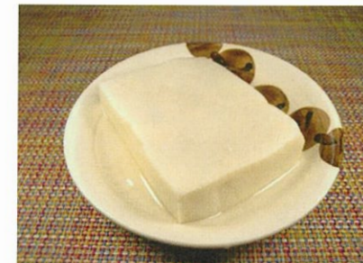
◆高野豆腐の含め煮 ●1枚 ¥110 鰹ダシをたっぷり含ませた惣菜。