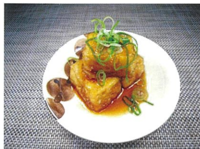
◆揚げ出し豆腐 ●1パック(3個入) ¥250 油で揚げた豆腐に、甘目のダシが染み込んだ揚げ物。