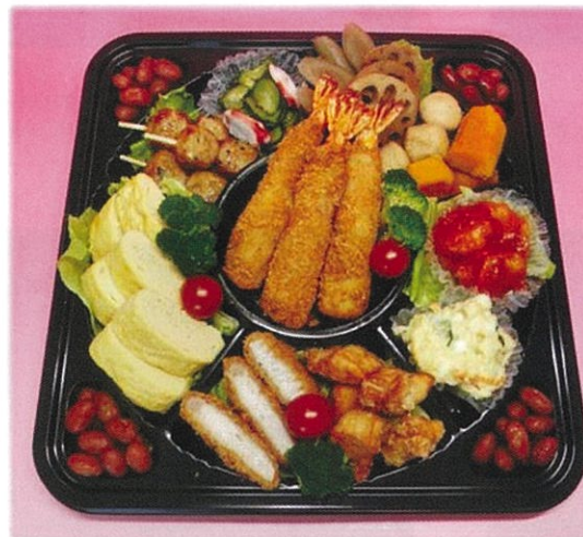
内寸 30×30×3.5 cm