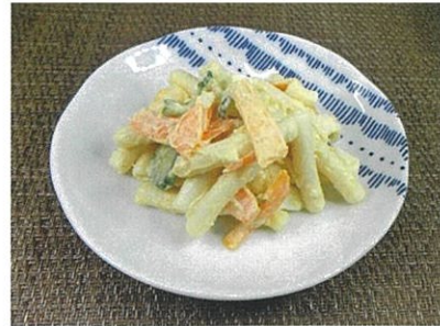
◆マカロニサラダ ●100g～ ¥220～ 中身は、マカロニ・胡瓜・人参・卵。 味付けもマヨネーズ・マスタード・塩コショウとシンプル。