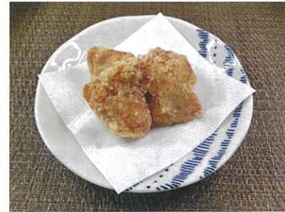
◆鶏肉唐揚げ ●100g ¥240 国産の鶏胸肉を使用した唐揚げ。