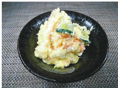
◆ポテトサラダ ●100g～ ¥220～ 中身は、じゃが芋・胡瓜・人参・卵。 味付けもマヨネーズ・塩コショウとシンプル。