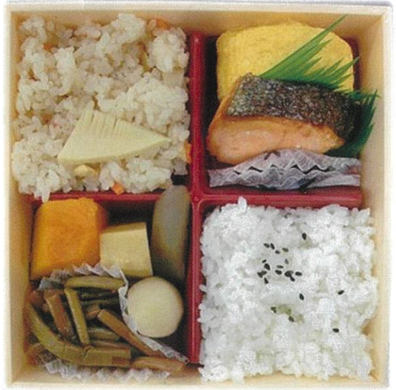
内寸 15.8×15.8×3 cm

菜々弁当 だし巻卵 ・主菜・・・だし巻卵。 ・副菜・・・煮物、和え物等。 ・ご飯・・・白ご飯+季節ご飯。 ※白ご飯を赤飯に変更できます。(+50円) 【販売価格】 ・直営店 560円 (税込) ・その他の店舗 560円 (税別)