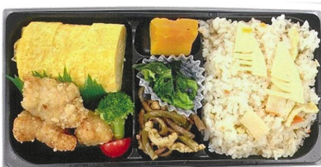
内寸 26.9×13.4×2.2 cm