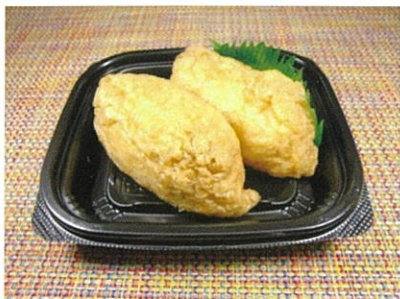
◆いなり寿司(2ヶ入) ●1パック(2ヶ入) ¥190 自家製ダシで煮詰めたお揚げに、程よい甘さの酢飯のいなり寿司。