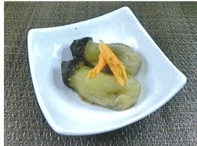
◆小なすのおひたし ●1個 ¥80 ※写真は2個です。 皮を取り、滑らかな食感の後味の良いおひたし惣菜。