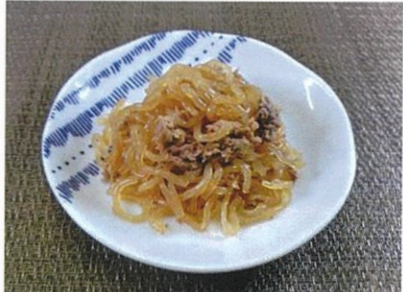
◆しらたきと牛肉のしぐれ煮 ●100g～ ¥250～ しらたきと牛肉をじっくり炊き込みました。