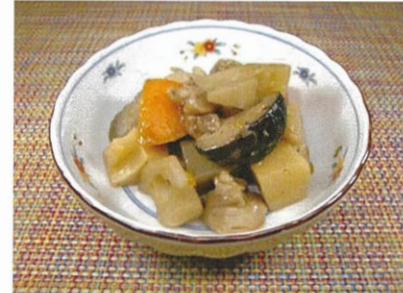
◆筑前煮 ●100g～ ¥320～ 鶏肉・蓮根・筍・椎茸・蒟蒻など、素材から出た天然ダシの旨味を生かした煮物。