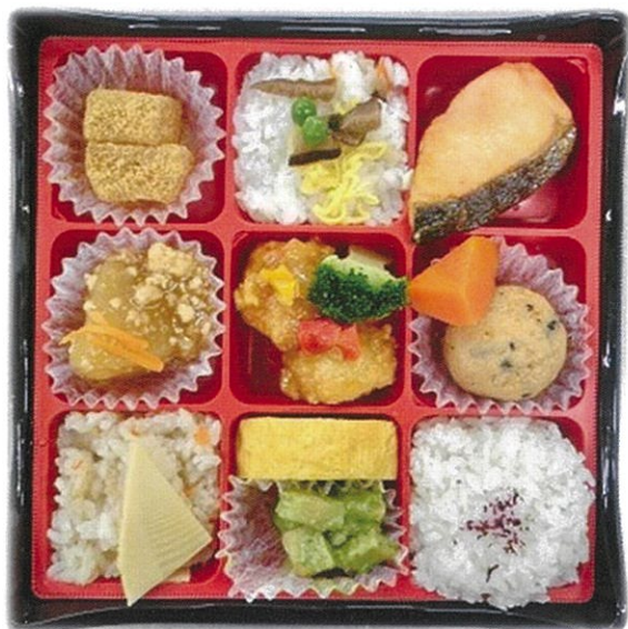
内寸 19.3×19.3×2.1 cm