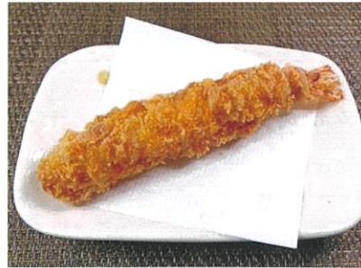
◆海老フライ ●1尾 ¥250 大ぶりの海老をフライにしました。