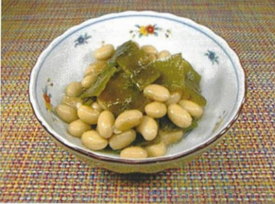
◆昆布豆 ●100g～ ¥200～ 北海道産の昆布・大豆を使用し、圧力釜で柔らかく炊き上げました。