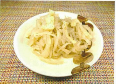
◆切干大根とおあげの煮物 ●100g～ ¥240～ 宮崎県産の天日干しした切干大根とお揚げの煮物。