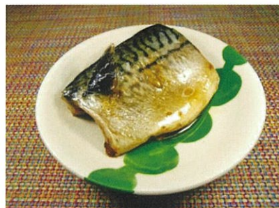
◆さばの煮つけ ※腹部・尾部があります ●1切 ¥260 ダシが餡状になるまで鯖と煮詰めた惣菜。