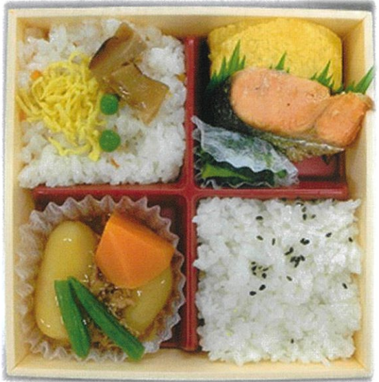
内寸 15.8×15.8×3 cm

一番人気・お値段お得 菜々弁当 (ちらし寿司) ・主菜・・・①天ぷら、②煮さば、③焼鮭、④焼さば、⑤ハンバーグ。 ・副菜・・・だし巻卵、煮物、和え物等。 ・ご飯・・・白ご飯+ちらし寿司。 ※白ご飯を赤飯に変更できます。(+50円) 【販売価格】 ・直営店 540円 (税込) ・西武大津、近鉄草津、コトチカ山科 520円 (税別) ・その他の店舗 540円 (税別)