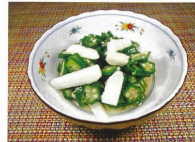
◆オクラと長芋のおひたし ●100g～ ¥260～ 細かく刻んだオクラに長芋を加えて、鰹風味のダシに浸しました。