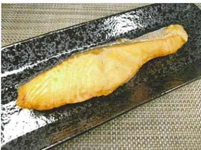
◆銀鮭の塩焼き ●1切れ ¥290 程良い塩加減で、ふっくら焼き上げました。