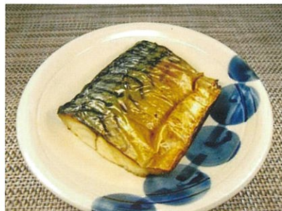
◆鯖の塩焼き ●1切れ ¥240 程良い塩加減で、ふっくら焼き上げました。