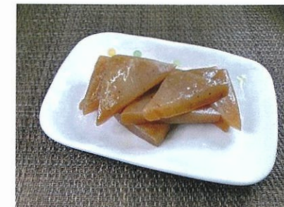
◆生芋こんにゃくの煮物 ●100g～ ¥300～ 群馬県産の蒟蒻芋を使用した、蒟蒻の風味と食感のある惣菜。